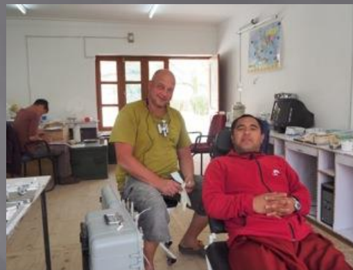
Liktsey, Gov. School