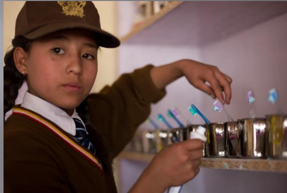
Kunfan school, Leh