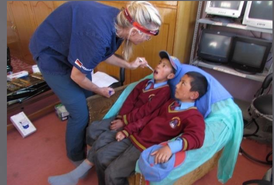
Sakti, Manjushree school