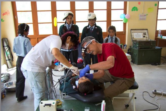
Wanla, Gov. School ,