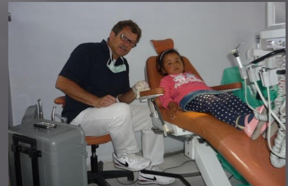
Saspol, Gov. School